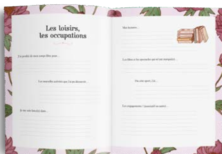
Partie 5 : Les années ont passé...