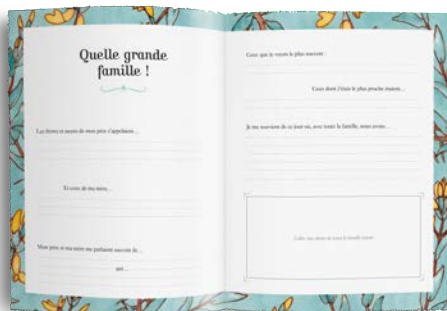
Partie 1 : Ma famille