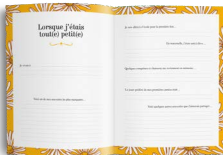
Partie 2 : Lorsque que j'étais enfant