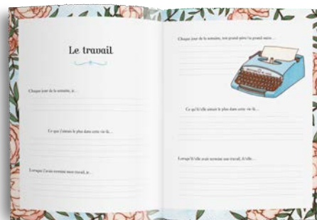
Partie 4 : La vie de famille