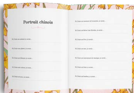
Partie 6 : Voici qui je suis