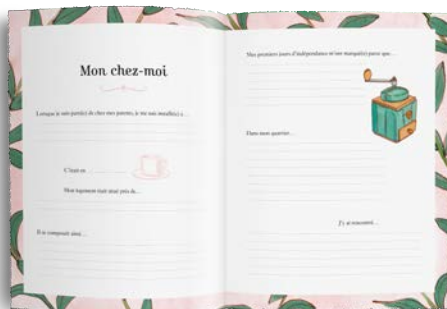
Partie 3 : Et puis j'ai grandi